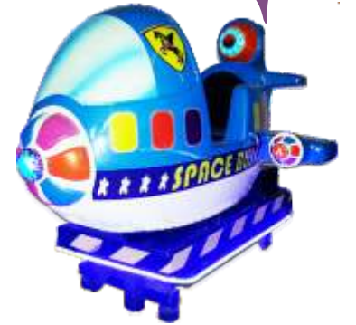
YP-QF057 Space bus 太空巴士