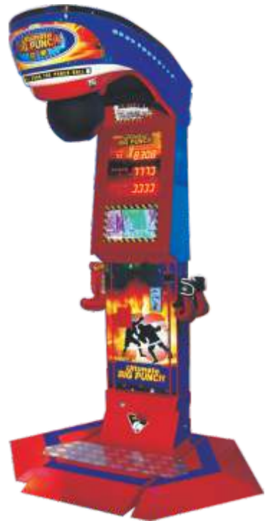
MA-QF300-1 可乐、奖品拳击机- Boxing

Recommended profitable product collocation