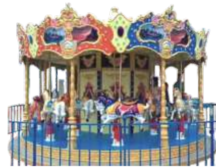
HR-QF903 12-Person carousel 12人旋转木马