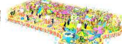
NC-QF807 Colorful fairy tale 淘气堡-缤纷童话