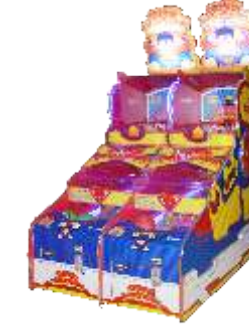
ML-QF835 Basketball super child 篮球超孩