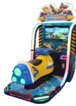
MR-QF832 Speed airship 极速飞艇