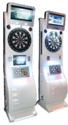
WW-QF808-5 Hardcover darts machine 精装飞镖机