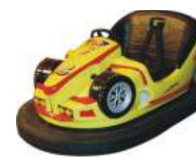
PQF-014 Bumper cars 碰碰车