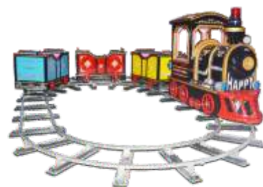
HR-QF877 Train track 轨道火车