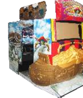
MS-QF120-1 Dead storm pirates 海盗大冒险