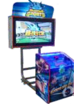
MS-QF819 sports shooting 奥运射击