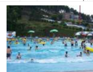
GS-QF910 Wave pool 海浪池