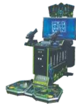
MS-QF060-4 Aliens Extention- 42 LCD 42寸液晶异形

Suits the crowd：15-40 years old of above.