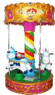
HR-QF018 Pony 儿童旋转木马