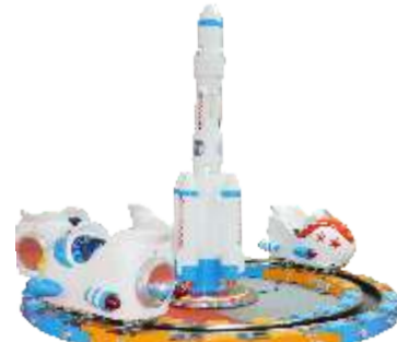
GS-QF802 Shenzhou IX 神舟九号