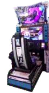
MR-QF847 Intital D Arcade stage 8 头文字D8