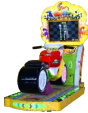
YA-QF909 Kids super motor 超级摩托(二代)