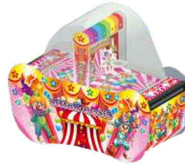
ML-QF922 Bee and clown 对战机(蜜蜂对战小丑对战)