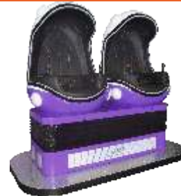
YY-QF002-2_New Egg Double seats 9D VR 9DVR两座紫色蛋形