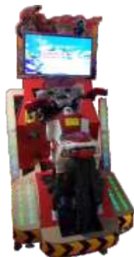
MR-QF852 22 LCD moto 22寸儿童普通摩托