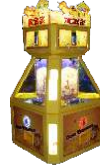
ML-QF1028 Cash tree 摇钱树