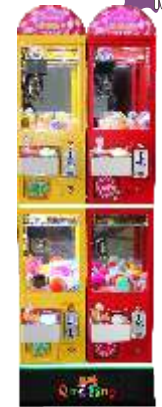
WA-QF903 Sweet Fun 糖果屋 (4人组)