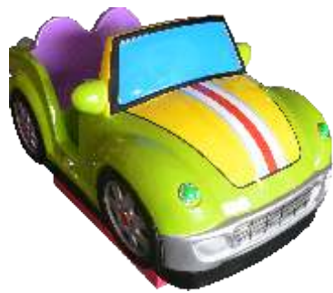
YA-QF889 Green sports car 绿色跑车