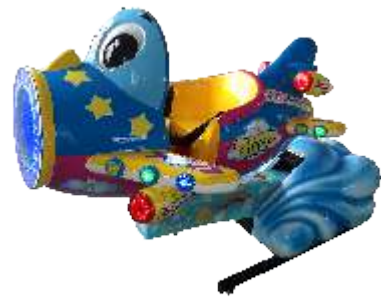
HR-QF870 Lifting small aircraft 升降小飞机

More than 3,000 game centers from over 170 countries are using our products.