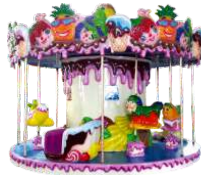
HR-QF902 12-Person Fruit carousel 12人水果旋转木马