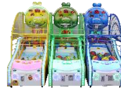
NA-QF501 DuDu basketball 嘟嘟嘟篮球机