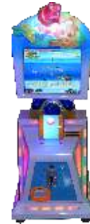
YE-QF002 Fishing machine 钓鱼机