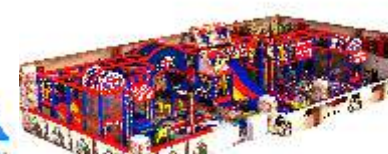
NC-QF806 England theme 淘气堡-英伦主题