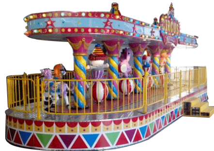
GS-QF843 Royal Circus 皇家马戏团