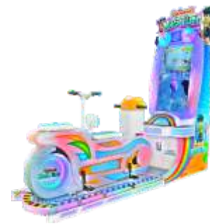
ML-QF1063 Magic Ride 奇幻之旅