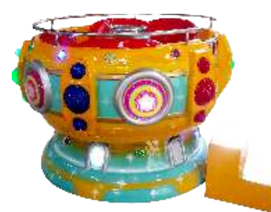
HR-QF803 Children's disco 儿童迪斯科