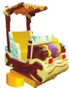
YP-QF021 Swing train 摇摆车