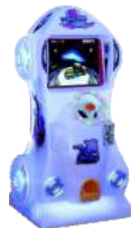
YE-QF012 Speed King 极速金刚