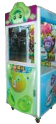
WA-QF8008 Grab the doll machine 零捌学糖娃娃机