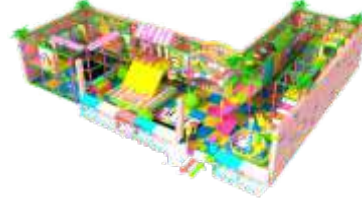
NC-QF804 Naughty castle 淘气堡