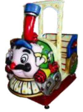
YA-QF224 Joyland 反斗乐园