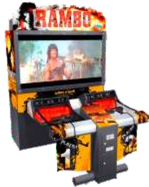
MS-QF080-1 Rambo 兰博