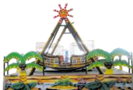
GS-QF502 Mini pirat ship 12人 海盗船