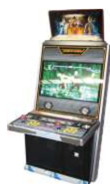
WW-QF207 Video game machine 32寸液晶框体机