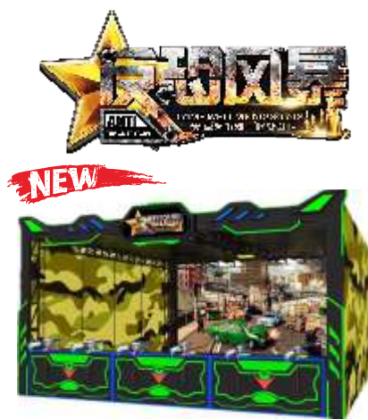
WW-QF903 Anti terrorist storm