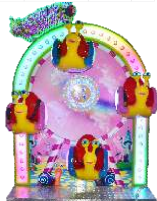
HR-QF806 Snail wheel 时钟蜗牛