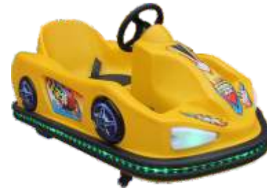
BC-QF842 Firewire drift 火线漂移