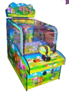
ML-QF382 Naughty Mouse 顽皮鼠