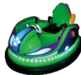
BC-QF8002 Candy bear bumper car 糖果熊碰碰车