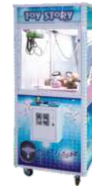
WA-QF110 Toy crane machine 娃娃机