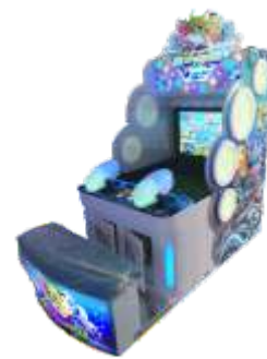
ML-QF839 Happy water war 快乐水战精华版