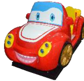
YA-QF885 Baby Racing 宝贝赛车