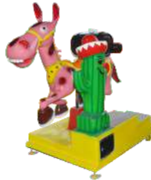
YA-QF029 Little Donkey 小毛驴