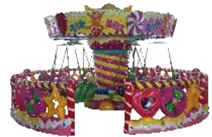
HR-QF864 Candy fly chair 糖果飞椅