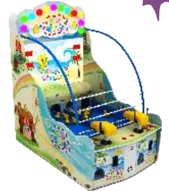
ML-QF919 Happy little duck 欢乐小鸭子