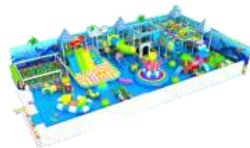
NC-QF803 Naughty castle 淘气堡