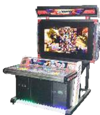
WW-QF806 Fighting game machine 42寸液晶格斗擂台