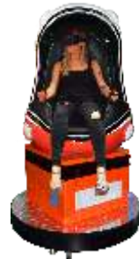
YY-QF001-1_New Egg Single seat 9D VR 9DVR一座橙色蛋形

Recommended profitable product collocation