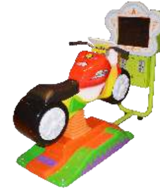
YA-QF878 3D Moto 3D豪华摩托