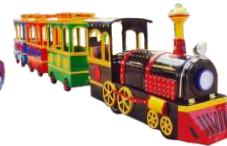
HR-QF879 Trackless antique train 老式无轨火车