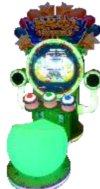
ML-QF1078 Piano Talent 钢琴达人