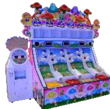
WA-QF886 Mushrooms play music 蘑菇弹弹乐