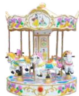
HR-QF310-3 6 seats revolving horse 6座 旋转木马