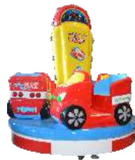
HR-QF814 Car AGE 汽车时代