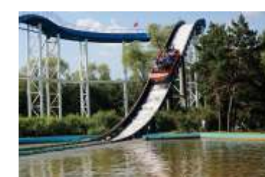
GS-QF928 Grand rapids 大激流