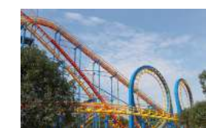
GS-QF929 Roller coaster 过山车