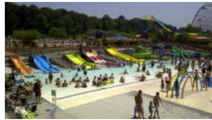
GS-QF913 Children slide 儿童滑梯