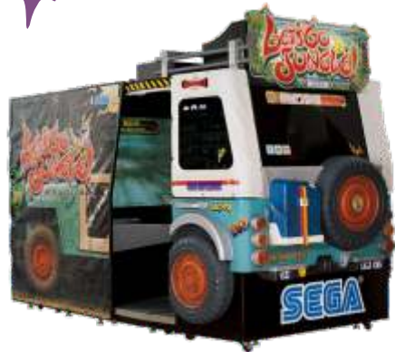
MS-QF170-1 55LCD Let's go jungle 55寸液晶丛林探险