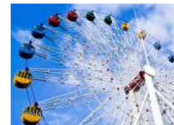
GS-QF922 42m Ferris wheel 42米摩天轮