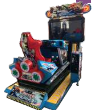
MR-QF826 55 LCD Full dynamic air raid 55寸全动感空袭