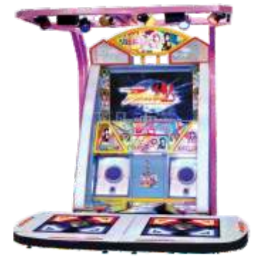
MA-QF715 Dancing age 炫舞世纪