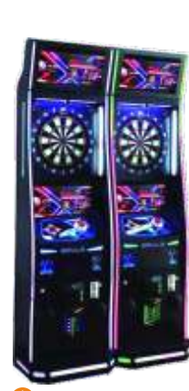
WW-QF808 Luxury dart machine 豪华飞镖机