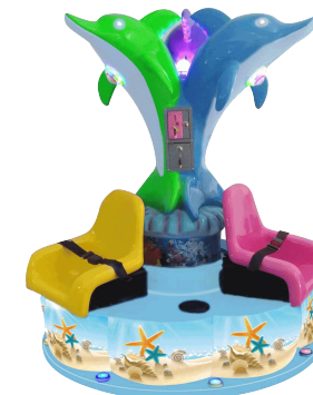
HR-QF894 Ocean disco 海洋迪斯科