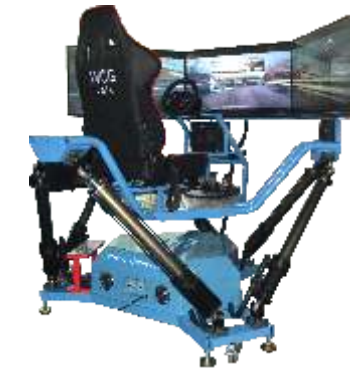
VR-QF090 Six-axis dynamic car 六轴三屏动感赛车