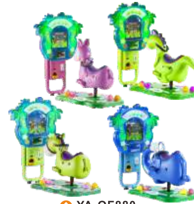
YA-QF880 Animal Family 动物家族