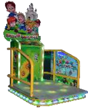
ML-QF869 Step on Ladybugs 踩虫虫