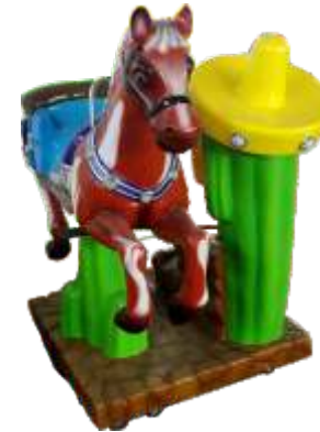
YA-QF284 happy Horse 逍遥马