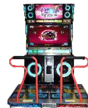
MA-QF301-1 Pump Fiesta 跳舞机 (韩国原装)