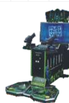
MS-QF060-4 Aliens Extention 42寸液晶异形