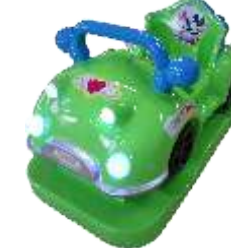
BC-QF842-3 Happy Shake 摇摇乐(一代)