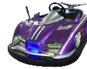
BC-QF842-1 Drift 漂移吧战神