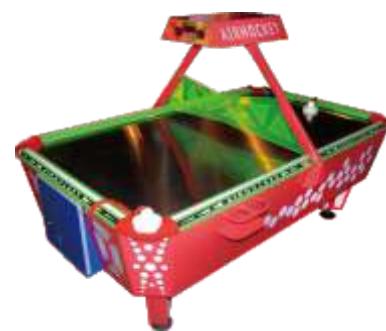
XP-QF8004 Colorful cushion hockey 炫彩气垫球