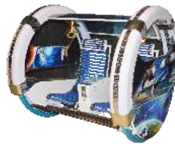
BC-QF835 Happy family car 太空乐吧车