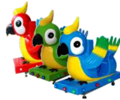
YA-QF894 parrot 鹦鹉