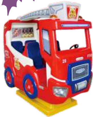
YA-QF847 Firetruck 救火车