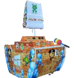
ML-QF502 Pirates(Double) 双人海盗