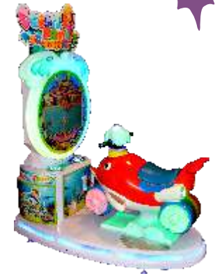
YA-QF884 Dolphin baby 海豚宝宝