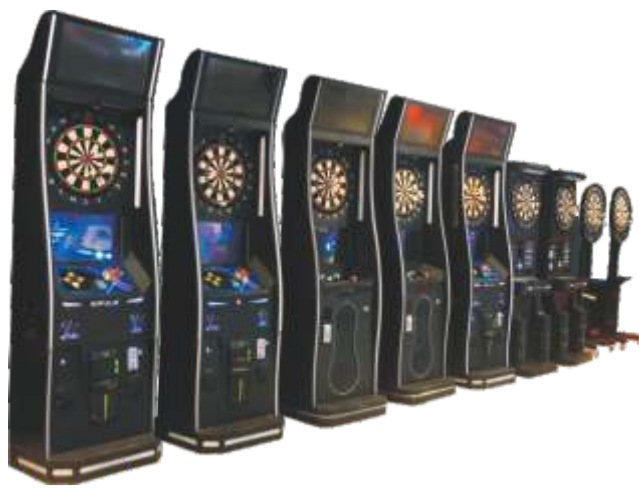
WW-QF808 飞镖机-Darts machine

Suits the crowd：3-36 years old of above.