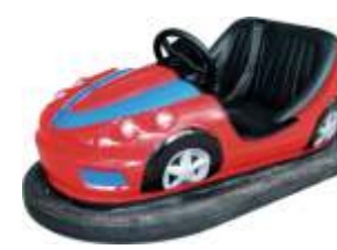
PQF-888 Children bumper cars 儿童碰碰车