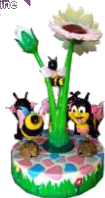
HR-QF008 Three rotating bee 3座 旋转蜜蜂