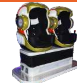
YY-QF002-3_Robot Helmet Double seats 9D VR 9DVR两座战甲头盔