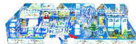
NC-QF805 Snow world 淘气堡-冰雪世界