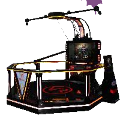
VR-QF095 VR World space walking platform 虚拟王国空间行走平台