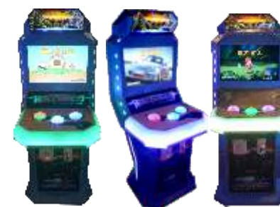
YE-QF018 伐木达人-厨房大作战 -疯狂彪车