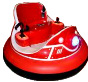
BC-QF840 Inflatable bumper car 充气碰碰车