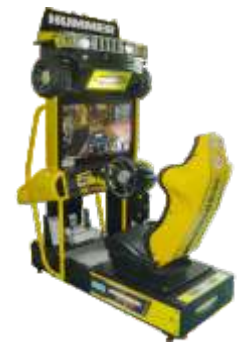
MR-QF240-1 32 LCD Hummer 32寸悍马