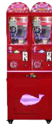
WA-QF904 Sweet Fun 糖果屋 (2人组)