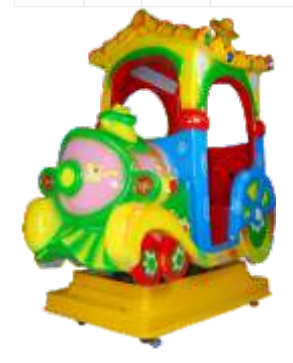
YP-QF020 Swing train 摇摆火车头