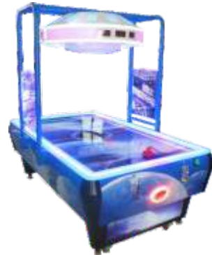
AH-QF827 Space hockey 太空曲棍球