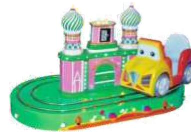
HR-QF833 Castle classic cars 经典城堡汽车