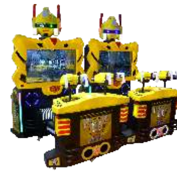
MS-QF827 Skiptrace 绝地逃亡