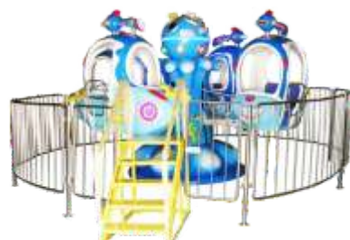
GS-QF506 Happy ocean 欢乐海洋