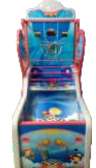
NA-QF820 Basketball 篮球机