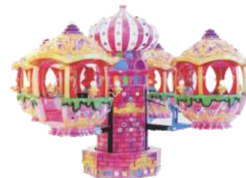
GS-QF805 Moving Castle 移动城堡