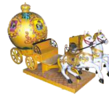
YA-QF028 Classic wagon 皇家马车