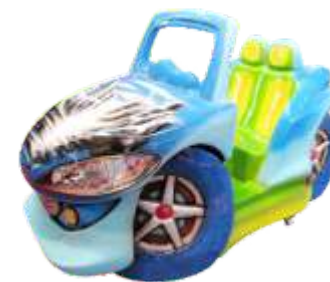
YA-QF030 Kiddy ride machine 儿童摇摆机