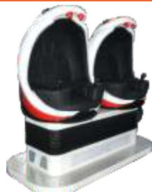
Cobra Double seats 9D VR 9DVR两座眼镜蛇形

Suits the crowd：4-40 years old of above.