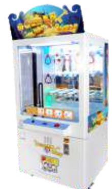
WA-QF226 Golden key 幸运钥匙