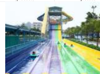
GS-QF909 Rainbow slide 彩虹滑梯