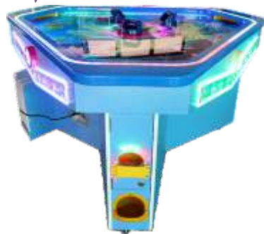
ML-QF813 Three people hockey 3人曲棍球