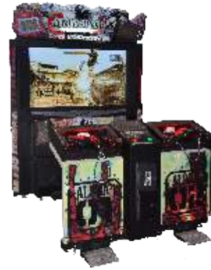
MS-QF140 55LCD Razing storm 完毁袭击