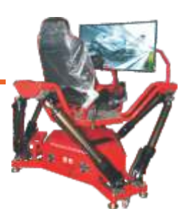
VR-QF088VR_six-axis dynamic racing car VR 六轴动感赛车