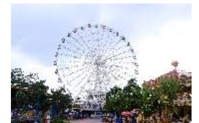
GS-QF923 50m Ferris wheel 50米摩天轮