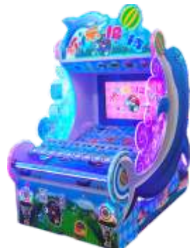
ML-QF1079 Joy to pitch 欢乐投球