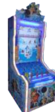
ML-QF920 Ice Age 冰河世纪