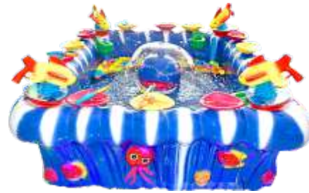
WA-QF858 Release pond 放生鱼池