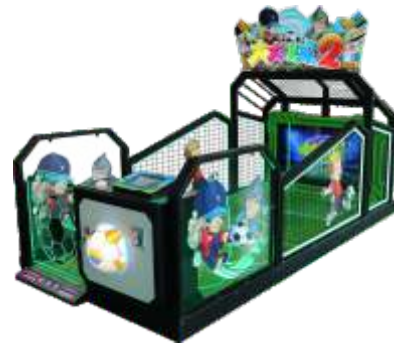
ML-QF1035 Big Football 大足球