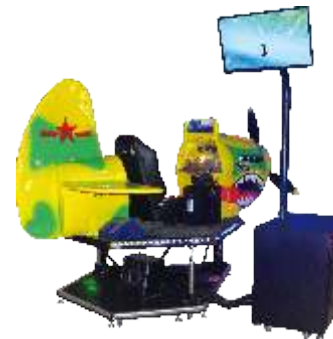
XP-8008 32 LCD Aircraft Wars 32寸飞机大战