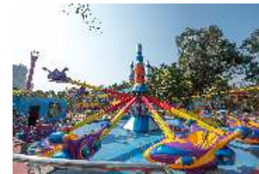
GS-QF921 24 self Autonomous aircraft 24座自控飞机