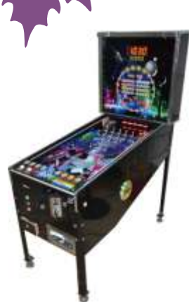
TZ-QF089-1 Pinball machine 弹珠机