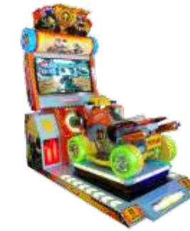
MR-QF825 42 LCD Full motion 4WD 42寸全动感四驱车