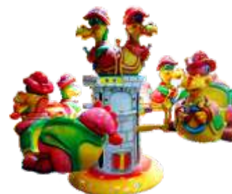
GS-QF016 Whirlwind donkey 旋风小飞龙