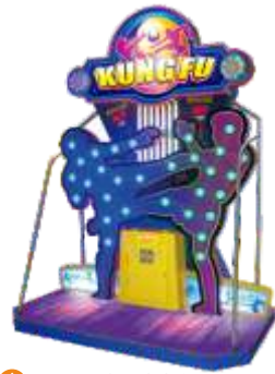
ML-QF661 Kung Fu 功夫