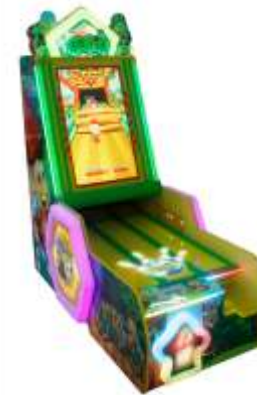
ML-QF1029 Happy bowling 欢乐保龄球