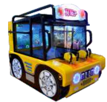
ML-QF1034 Fight the enemy 打鬼子