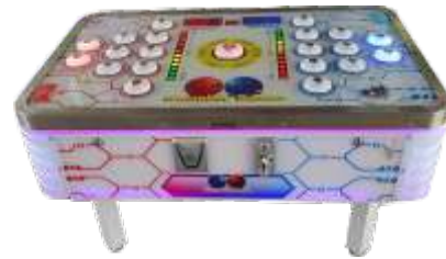
ML-QF831 Beat Beans crystal 打豆豆