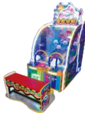
MA-QF8007 Shooting machine 零捌学糖射球机