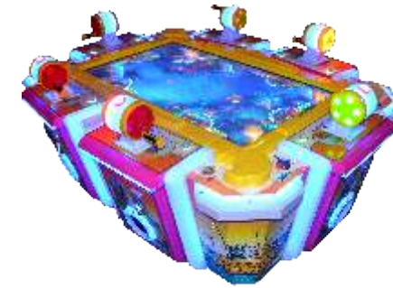
ML-QF1039 Kitten fishing 小猫钓鱼