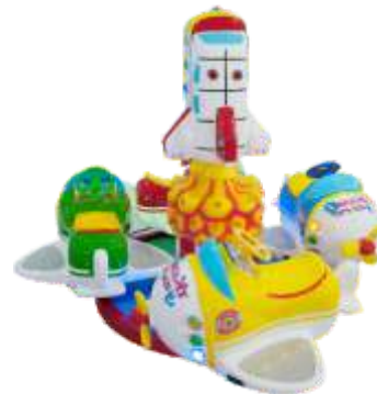
HR-QF812 4 seats train 梦想小飞机2代