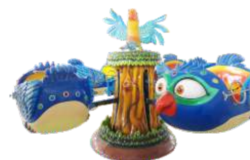
GS-QF013 Space parrot 太空鹦鹉