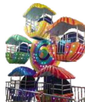
GS-QF503 Ferris Wheel 摩天轮