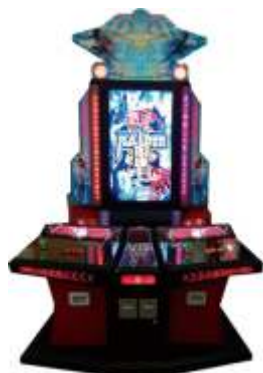
WW-QF506 Plane 飞机