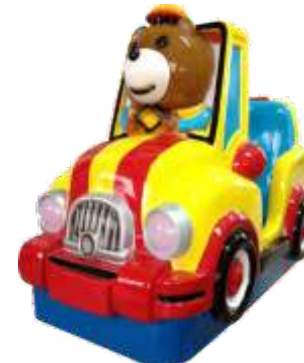
YP-QF053 Little bear car 小熊车车