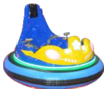
BC-QF843 Spacecraft 太空飞船