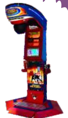
MA-QF300-1 Boxing 拳霸擂台