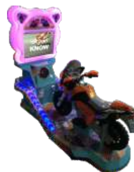
MR-QF850 22 LCD Child motorcycle 22寸儿童摩托