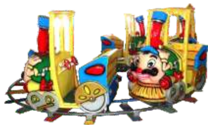
GS-QF019 Toy land 反斗乐园火车