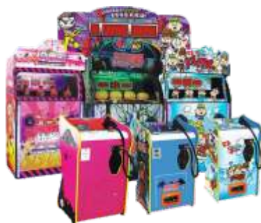
MS-QF809 Forest Ghost 森林幽灵