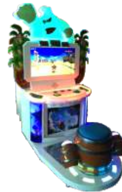
WA-QF865 orangutan 猩猩