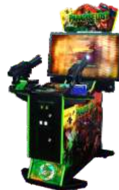
MS-QF070-4 All dynamic Paradise Lost 42寸液晶越战