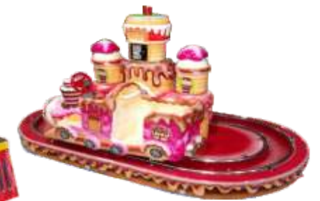
HR-QF816 Cake train 蛋糕小火车