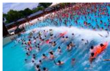
GS-QF915 Tsunami pool 海啸池