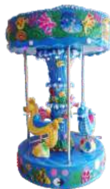
HR-QF883 Hippocampus carousel 海马转木马