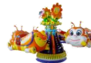
GS-QF047 Whirlwind bee 旋风蜜蜂