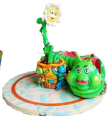
TR-QF035 Mini Worm 双座果虫车