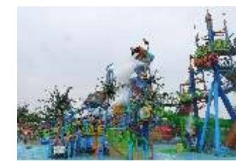
GS-QF908 Large water village 大型水寨