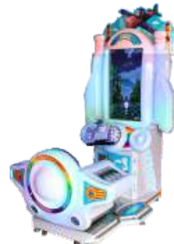
MR-QF828 Air overlord 空中霸王