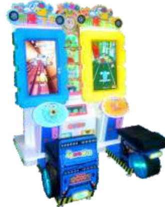
ML-QF830 Blond flying car 布隆飞车