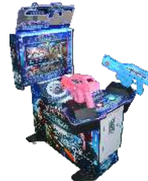
MS-QF824-1 32 LCD Taipei Power 32寸火力全开