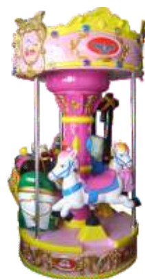
HR-QF012 Little Carousel 小旋转木马