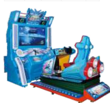
MS-QF207-1 The fighter plane 2 空中战机二代