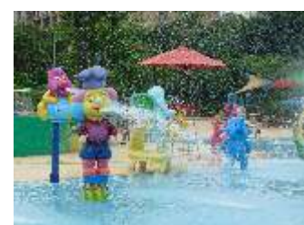
GS-QF920 Cartoon clown 戏水卡通小丑