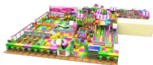
NC-QF802 Naughty castle 淘气堡