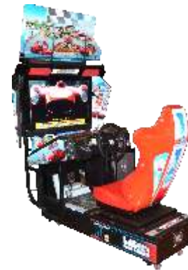
MR-QF210-4 32"LCD Outrun Single player 32寸单人环游