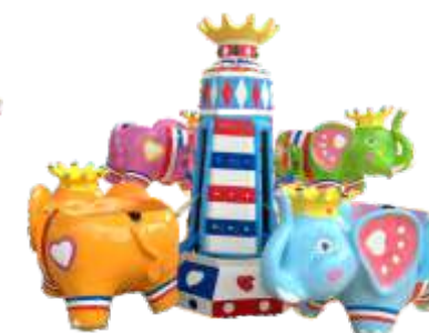
HR-QF885 Flying Elephant 小飞象