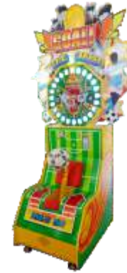
ML-QF836 Goal 一球成名