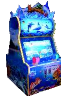
ML-QF1006 Go fishing 小熊钓鱼 (4人)