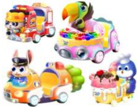
YA-QF893 小小梦想家系列摇摆机 (3D互动屏)