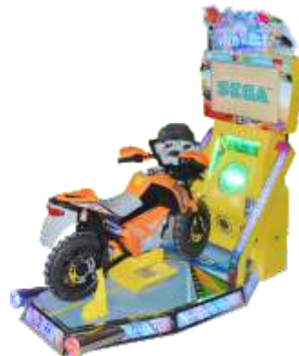
MR-QF311 22LCD Children's luxury TT motor 22寸豪华儿童摩托