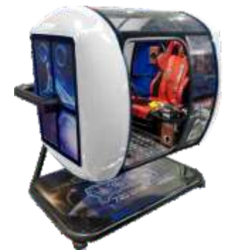
VR-QF097 720° rotating capsules(Commom&VR) 720°旋转太空舱(普通款, VR款)