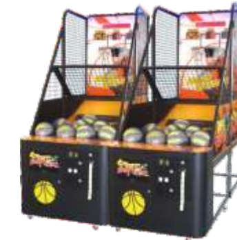
NA-QF057 Basketball machine 篮球机