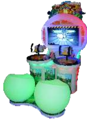
ML-QF1069 37 inches fruit fight 37寸水果大战