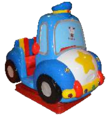
YA-QF307 Traffic police 交通警察