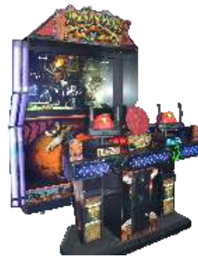
MS-QF120 Dead storm pirates 站立式海盗大冒险