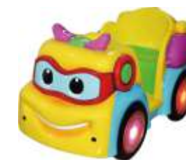
BC-QF823 Battery car 电池车