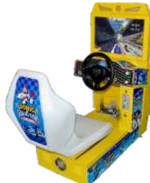
MR-QF289 22LCD mini Sonic 22寸迷你索尼克