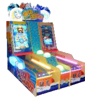
ML-QF826 Ocean bowling 海洋保龄球