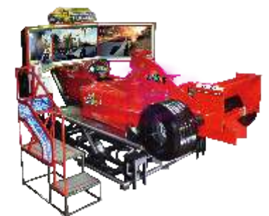
MR-QF811 World Racer F1 simulator 世界赛车