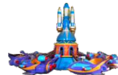
GS-QF842 Automatic aircraft 自控飞机