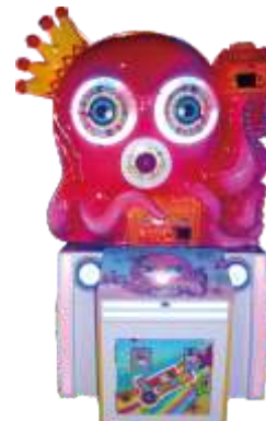
XP-QF8051 Lucky octopus 幸运章鱼