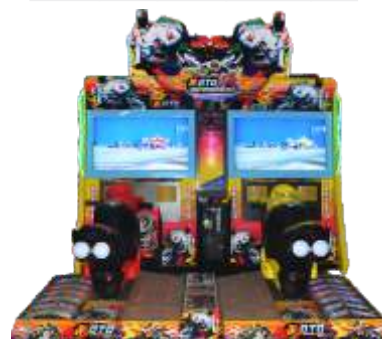
MR-QF892 42 LCD TT Moto 42寸液晶TT摩托