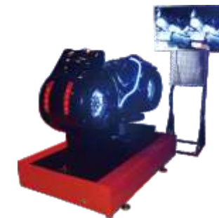
XP-8021 VR Motorcycle (black) VR摩托车(黑色)