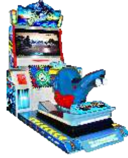
MR-QF835 42 LCD Full-motion - street motorcycle 42寸全动感-街头摩托