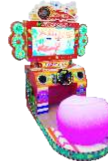
MR-QF815 The flame speed 火焰飞车