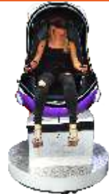
YY-QF001-2_New Egg Single seat 9D VR 9DVR一座紫色蛋形