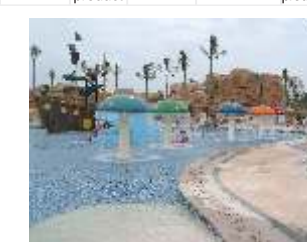
GS-QF911 Rainbow mushroom 七彩雨蘑菇