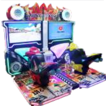
MR-QF855 42 LCD luxury TT motorcycle 42寸豪华TT摩托