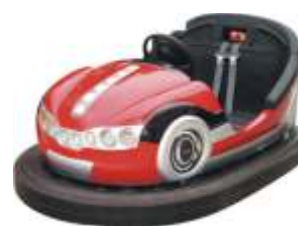
PQF-009 Bumper cars 碰碰车