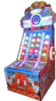
WA-QF885 Lucky millionaire 幸运大富翁 (双人)