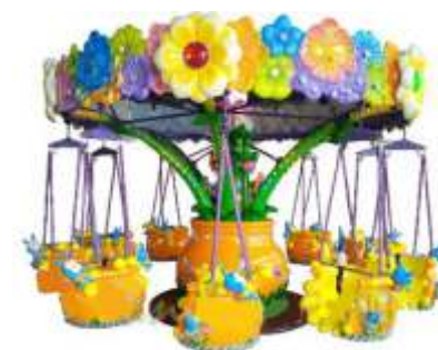
GS-QF807 Flower paradise 天堂花园