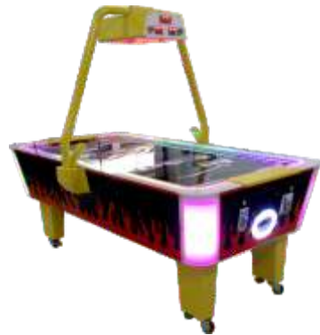
AH-QF822 Flame hockey 火焰曲棍球