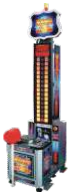
ML-QF505 The king of hammer 大力士 (豪华版)