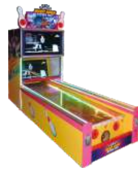
XP-QF8011 42 LCD Mickey mouse bowling 42寸教练保龄球