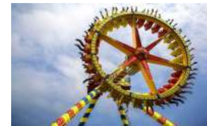
GS-QF925 30 self Big pendulum 30座大摆锤