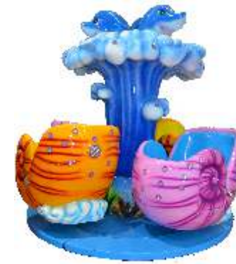
HR-QF801 Carousel 小海洋旋转木马