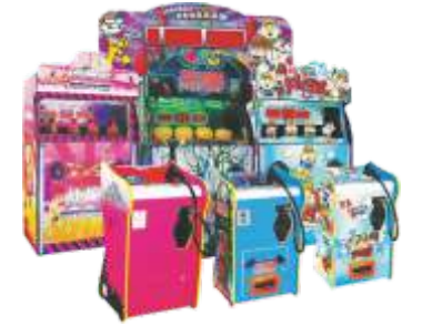
MS-QF809 Forest Ghost 森林幽灵