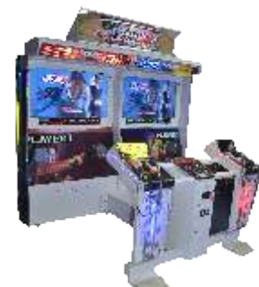
MS-QF020-1 42LCD time crisis 4 42寸液晶化解危机4代