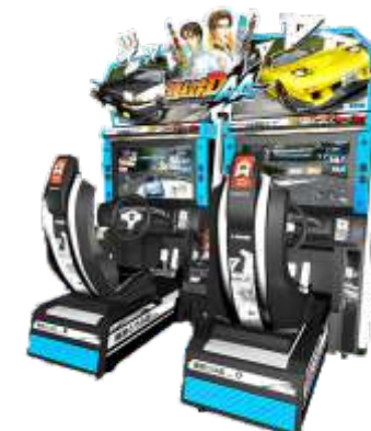
MR-QF291-3 Intital arcade stage 6 头文字D 6