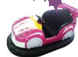
PQF-006 Bumper cars 碰碰车