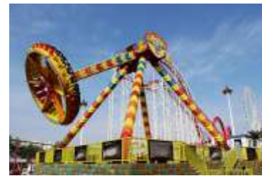
GS-QF924 23 self Big pendulum 23座大摆锤