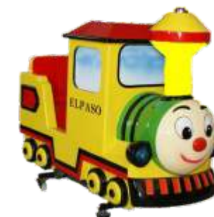
YP-QF047 Happy train 快乐小火车