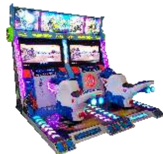
MR-QF834 Double street motorcycle 双人街头摩托