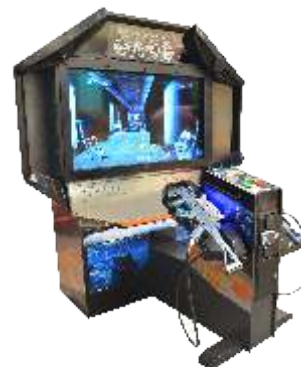
MS-QF307 55" LCD ghost squad 幽灵特警55寸