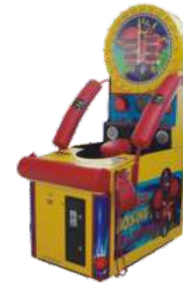
MA-QF300-3 World boxing champion 拳皇争霸