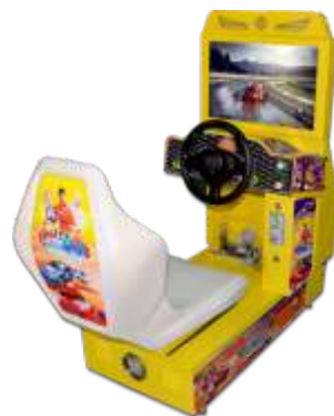
MR-QF288 Little Outrun 小环游