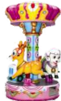
HR-QF802 3 seats carousel 3座小旋转木马