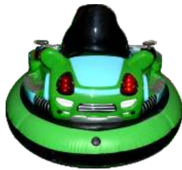
BC-QF838 Space Battleship 太空战舰