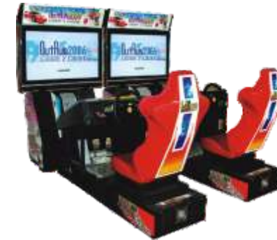
MR-QF210-6 42 LCD Outrun double 42寸液晶环游世界双人 (不连线)