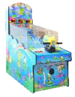
ML-QF662 Frog prince 青蛙王子