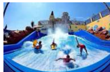
GS-QF916 Skater Surfers 滑板冲浪