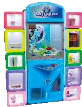
WA-QF870 Gift Machine 礼品机