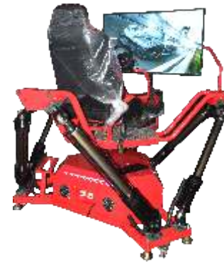
VR-QF088 VR six-axis dynamic racing car VR六轴单屏动感赛车