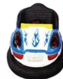
BC-QF817 Bumper cars 碰碰车