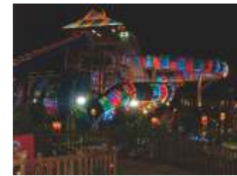
GS-QF917 Python slide 巨蟒滑梯