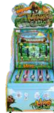
ML-QF1075 Monkey climb 猴子爬树