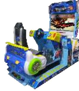
MR-QF836 3D Doom melee 3D末日混战