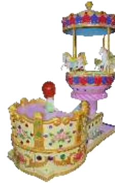
HR-QF804 Fairy tale rotating movements 童话世界