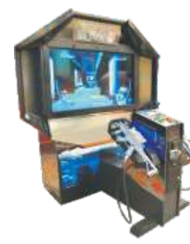
MS-QF307 55 LCD ghost squad 55寸幽灵特警