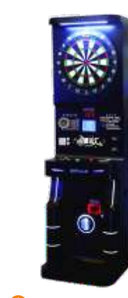
WW-QF808-1 Hardcover darts machine 精装飞镖机