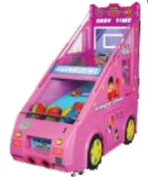
NA-QF060 Baby time basketball 欢乐宝贝