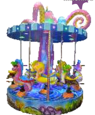
HR-QF808 9 seats sea carousel 9人小海马旋转木马