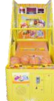
NA-QF061 Happy baby 快乐宝贝