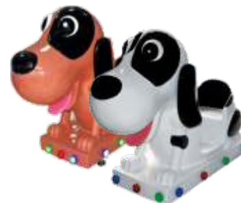
YA-QF898 speckle dog 旺旺狗(12寸3D互动屏)