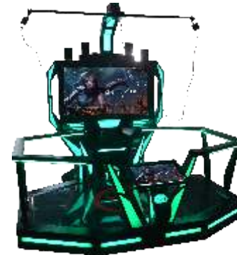
VR-QF096 VR World space walking platform 虚拟王国空间行走平台