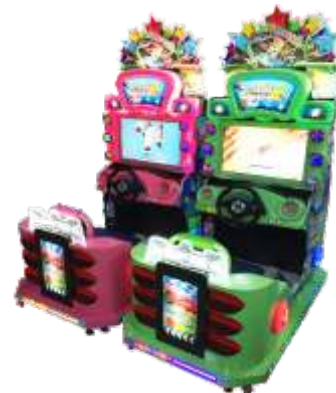
MR-QF804 R Paradise 反斗乐园(索尼克)