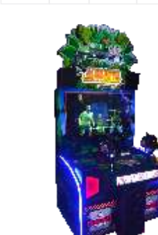
XP-QF8015 Jungle adventure 丛林探险