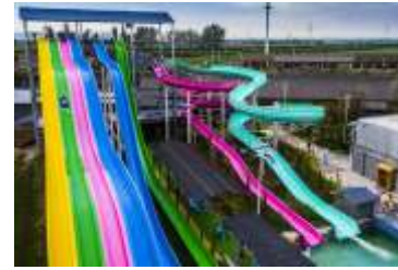
GS-QF914 High speed combination slide 高速组合滑梯