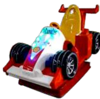
YA-QF910 Formula car 方程式赛车