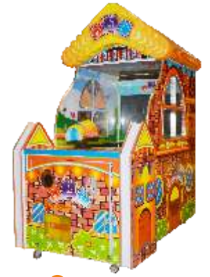
ML-QF947 Drink house 饮料屋