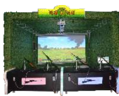
MS-QF831 Hunting hero 狩猎英雄