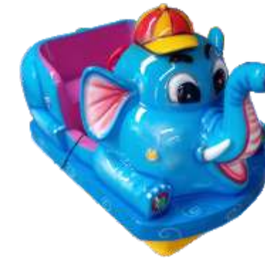
YA-QF826 Little Elephant 小象