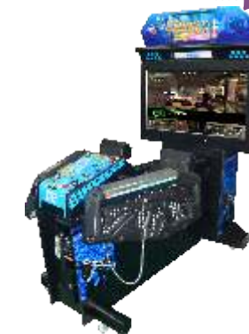
MS-QF160-1 Ghost squad 42寸魔鬼特警