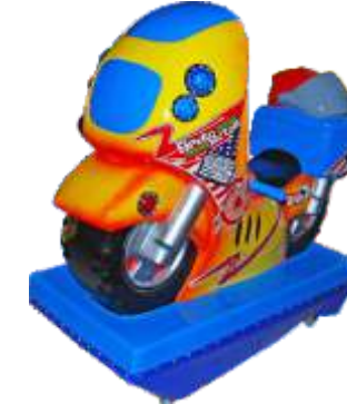
YA-QF819 Speed moto 极速摩托车