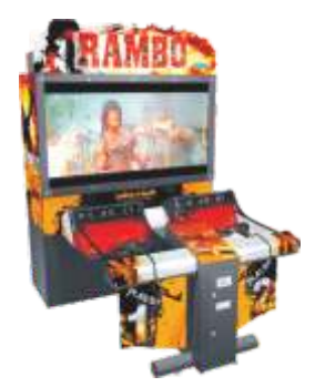
MS-QF080-1 RAMBO 兰博