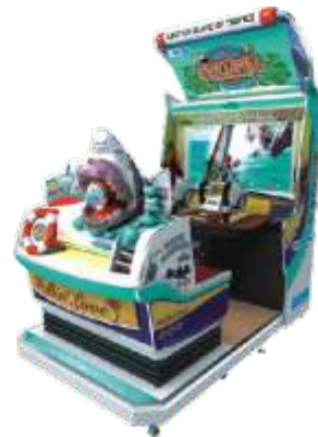
MR-QF829 42"Adventure island 42寸海岛探险