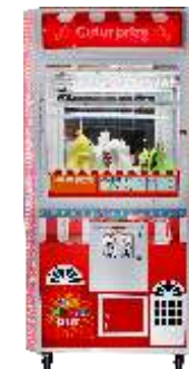
WA-QF905 Cut ur prize 剪刀帝国