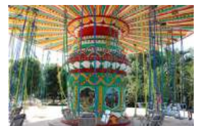
GS-QF926 Flying chair 飞椅