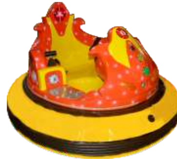
BC-QF836 Baby Chariot 宝贝战车