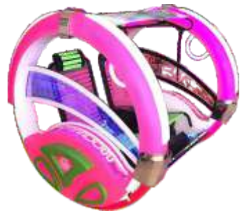
BC-QF835 Happy family car 太空乐吧车