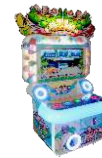
ML-QF1042 Crocodile Story 鳄鱼总动员