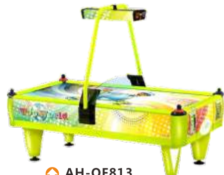
AH-QF813 Four people hockey 4人曲棍球