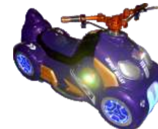
BC-QF839 Prince motorcycle 太子摩托