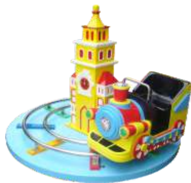
TR-QF393 Happy train 欢乐火车头