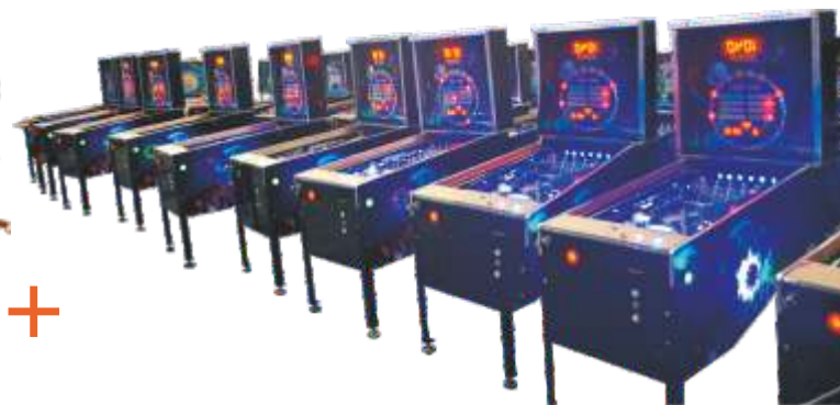
TZ-QF089 弹珠机弹珠机-Pinball machine