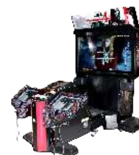
MS-QF130 House of the dead-4 鬼屋4代鬼屋4代