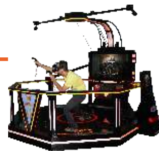
VR-QF095_VR World space walking platform 虚拟王国空间行走平台