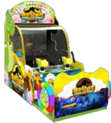
ML-QF844 age dinosaur 侏罗纪时代