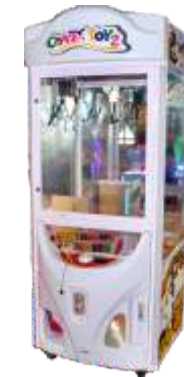
WA-QF856 Crazy toy 2 疯狂玩具 (娃娃机)