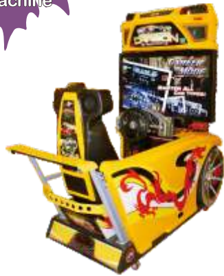
MR-QF270 42 LCD Need for speed 42寸液晶极品飞车