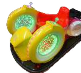
BC-QF806 Space coaster 太空飞车