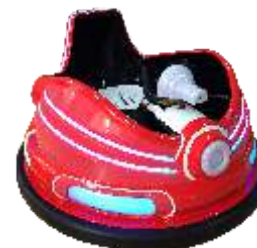
BC-QF842-2 Light shadow chariot 光影战车