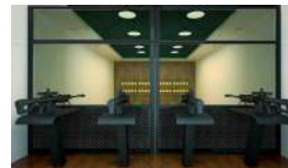
WW-QF905 Live ammunition gun 实弹气步枪