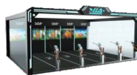
WW-QF904 Special Equipment 极限射箭