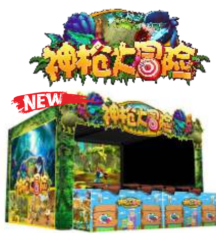
WW-QF902 Gunslinger Adventure