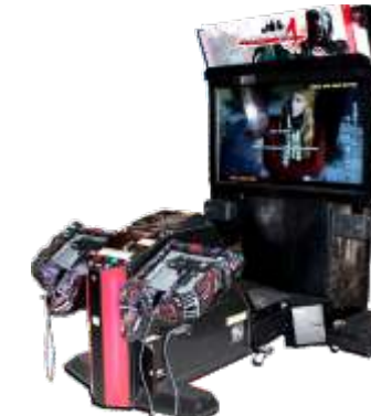
MS-QF130 The house of the dead 4 鬼屋4代