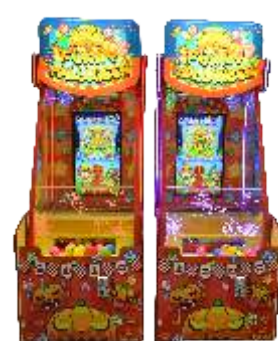
ML-QF910 Halloween 万圣节