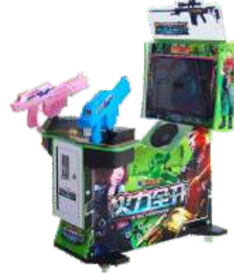
MS-QF824 22 LCD Taipei Power 22寸火力全开