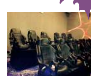
DC-QF905 5D luxury seats 5D 豪华座椅