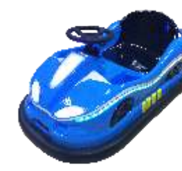
BC-QF842-4 Happy Shake 摇摇乐(二代)