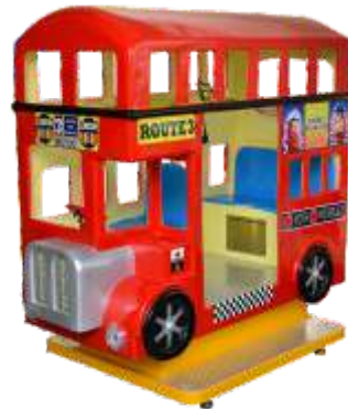
YA-QF041 London Bus 伦敦巴士