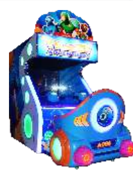
ML-QF1010 Travel Adventures 环游历险