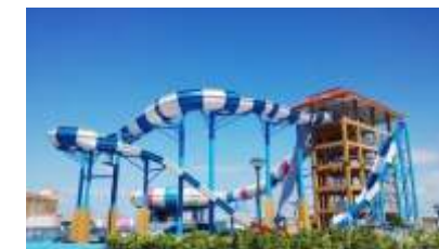
GS-QF907 Soaring cyclotron slide 冲天回旋滑梯