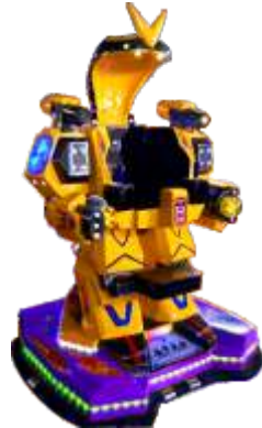
BC-QF859 ArmorLock 铁甲战士