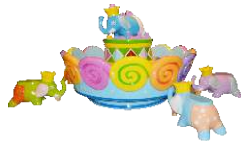
WA-QF847 Cake sand table 糖果火星桌