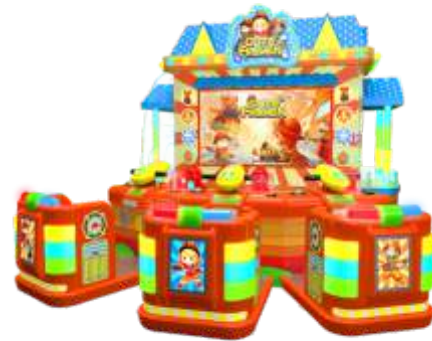
ML-QF1027 Fireman 消防员