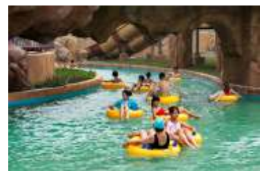
GS-QF919 Lazy river 漂流河