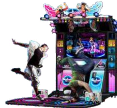
MA-QF813 Dance dance day 舞法舞天