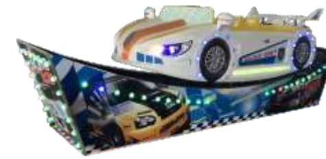
HR-QF904 Speed car 极速飞车