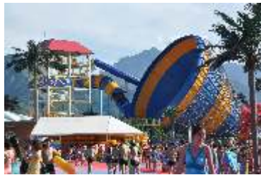
GS-QF912 Big horn slide 大喇叭滑梯