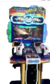
MS-QF832 Transformers 42寸钢铁战士