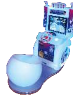
YE-QF024 Speed racing 极速飞车