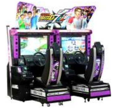
MR-QF291-4 Intital D Arcade stage 7 头文字D7代双人