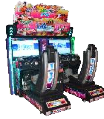
MR-QF824 32 LCD Luxury Dynamic Outrun 32寸液晶豪华动感环游双人