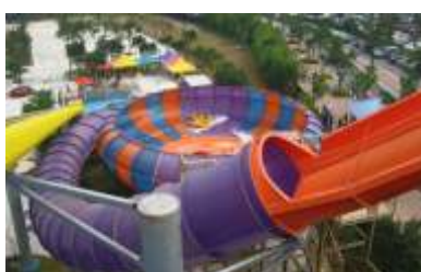
GS-QF918 Behemoth Bowl 巨兽碗