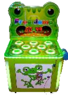
ML-QF1051 Frog Jump 疯狂打青蛙