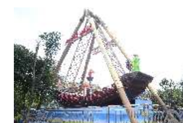
GS-QF927 32 self Pirate ship 32座海盗船