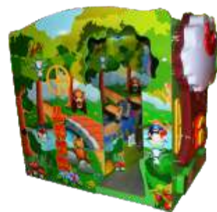
ML-QF1011 Jungle adventure 丛林冒险