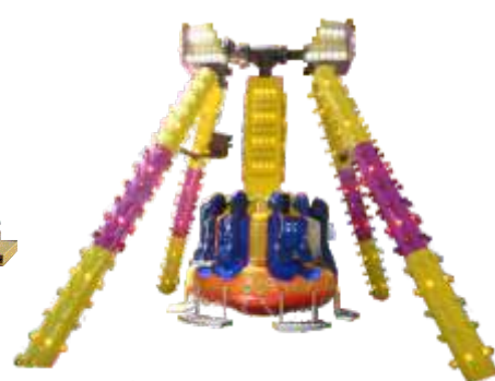
GS-QF816 Small pendulum 小摆锤