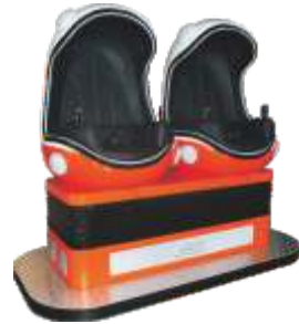
YY-QF002-1_New Egg Double seats 9D VR 9DVR两座橙色蛋形