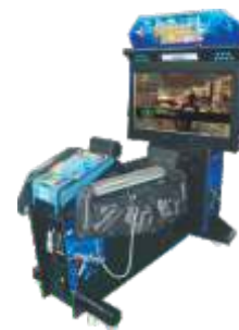
MS-QF160-2 42 LCD Ghost squad 42寸魔鬼特警