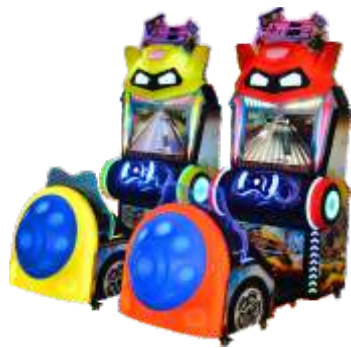
MR-QF827 Mirror Wars 幻影一号