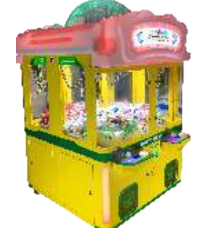
BC-QF860 Happy baby 欢乐宝贝