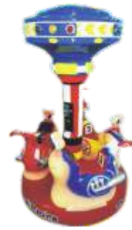
HR-QF886 Rotating snail 旋转蜗牛