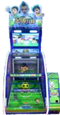
ML-QF1037 Captain Tsubasa 足球小将