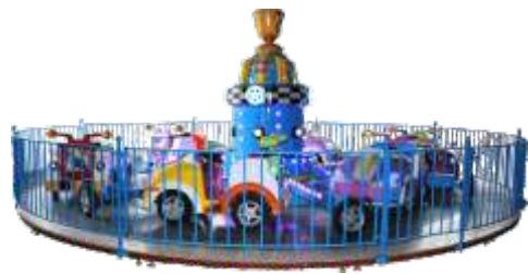
HR-QF905 Drift speed 12人漂移飞车