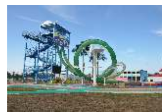
GS-QF906 Big circle 大回环