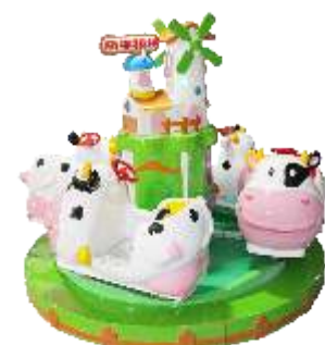
HR-QF891 Adorable cattle ranch 萌牛牧场