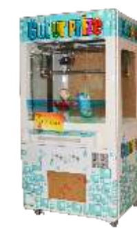
WA-QF225 cut your prize 剪刀手