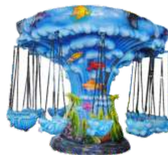
GS-QF841 Seaworld flying chair 海洋世界飞椅