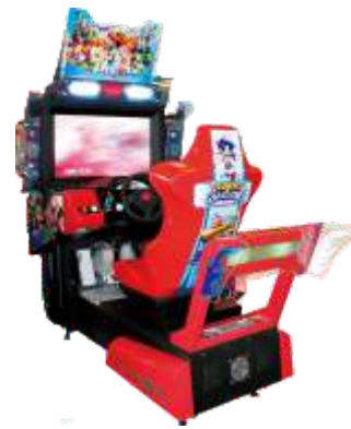
MR-QF298 32 LCD Sonic 32寸单人索尼克