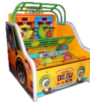
NA-QF810 Taxi Hoop 的士篮球