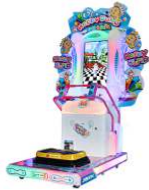
XP-QF8043 Happy jump 欢乐跳跳跳