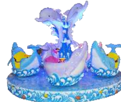
HR-QF880 Dolphin(Metallic reflection) 海豚梦幻海洋木马