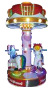
XP-QF8001 Happy Childhood 快乐童年3人转马