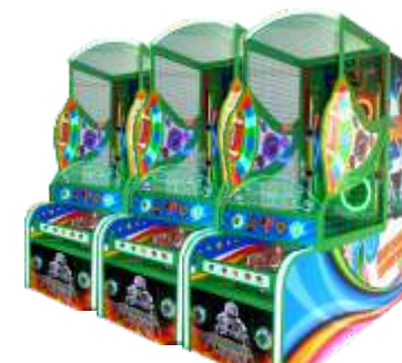
NA-QF1061 Football league 橄榄球