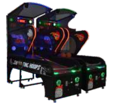
NA-QF058 Basketball machine 豪华篮球机