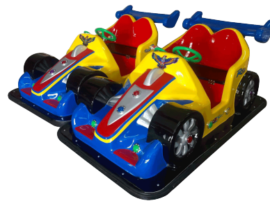
YP-QF032 Raider buggies 四驱车