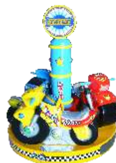
HR-QF811 Rotary moto 旋转摩托