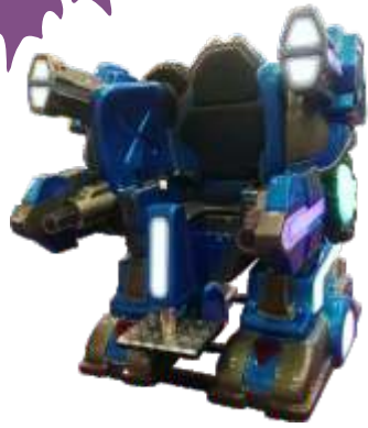
HR-QF889 Space fighting chariot 机甲战车