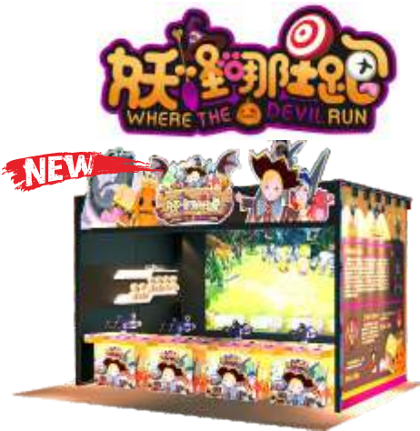
WW-QF901 Where the devil run