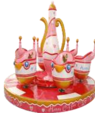
HR-QF828 6 Seats happy coffee 咖啡杯转盘