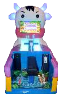
YE-QF017 Small buffalo 小水牛