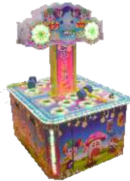
ML-QF1049 Double play hamster 双人打地鼠