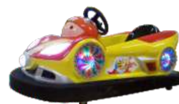
BC-QF822 Drift 漂移吧战神