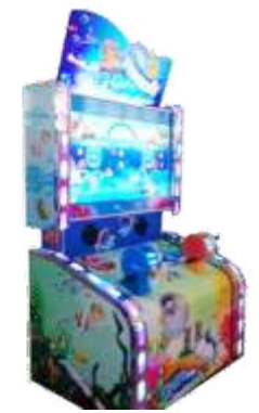
ML-QF932 Go Fishing-LXY 小熊钓鱼-豪华版